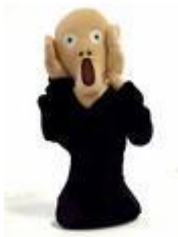
写真1；エエーほんと！！